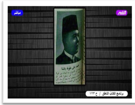
محمَّد عليّ علوية باشا. الصورة الَّتِي بعدها:

صُورته من أنَّ السَّببَ الَّذِي رُبَّمَا لا يُؤدِّي إلى اختياره هو لِكَونه بعيداً عن مصر، لِكَونه في إيران وهو بعيد عن أجواء الإخوان، وإلَّا فلا يوجد مانع من أن يكون هذا المرجع الشيعي المعروف وهو مرجع من مراجع الشيعة، من الشخصيات والزعامات السياسيَّة من الطراز الأوَّل، كان شخصيَّةً معروفةً في حوزة النجف وحينما ذهب إلى إيران صار شخصيَّةً دينيَّةً وعلميَّةً وسياسيَّةً من الطراز الأوَّل، وحركة مُصدِّق في إيران، أنا هنا لا أريد أن أتعرَّض للتأريخ الإيراني، لكنني لو حدَّثتكم عن حركة مُصدِّق في إيران فإنَّ السَّببَ الأكبر في نجاحها هو هذا المرجع، لأنَّه أيَّد حركة مُصدِّق، وبسبب تأييد السيِّد أبي القاسم الكاشاني استطاع مُصدِّق أن يُخرِج الشَّاه من إيران وأن يُؤسِّس حكومةً في إيران، وحينما سَحَب هذا السيِّد تأييده من مُصدِّق فهذا هو الَّذي أدَّى إلى سقوطه ورجوع الشَّاه مرَّةً ثانية، فهو شخصيَّة لها تأثير كبير جدًّا في الواقع السياسي والديني والاجتماعي الإيراني آنذاك. الصورة الَّتِي بعدها: